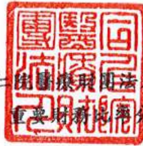
同仁醫院 表14 重要財務比率分析