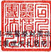
同仁院醫療財團法人 表12-2 居家護理所會計年度資產負債表