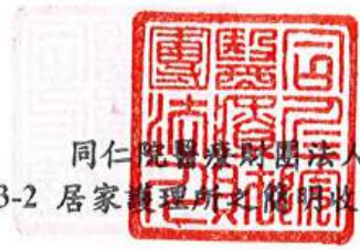
同仁醫院醫務財團法人 表13-2 居家護理所之簡明收支餘絀表